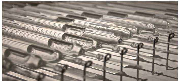
Nivells dinàmics de compensacions contínues, 2012