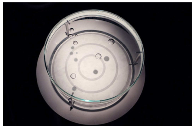
Nivell circular, 2014