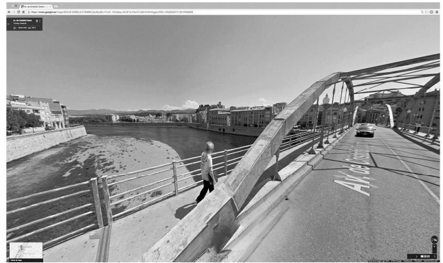
Llei 52/2007, article 15